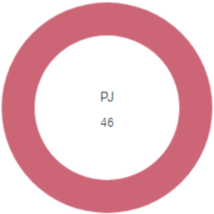
Répartition en coût