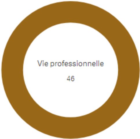
Répartition Typologie en Volume